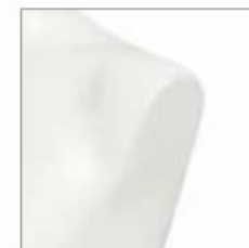
Senza tappo spalla